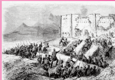
.ATTAQUE DU PÉNITENCIER DE PUEBLA

Quant aux crucifix, qui se trouvaient dans chaque maison, ils ont été collectés par un aumônier militaire ..