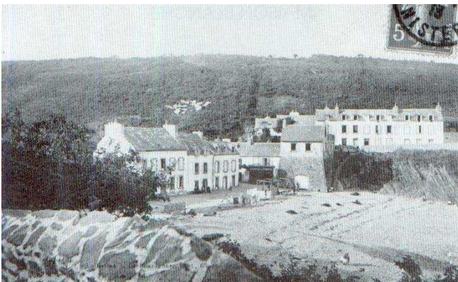
Maison Blanche vers 1930

Afin de concrétiser notre démarche, nous avons le plaisir de vous présenter un des sites récemment visité.