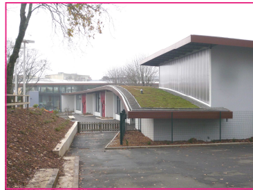
Toit herboré de l'école