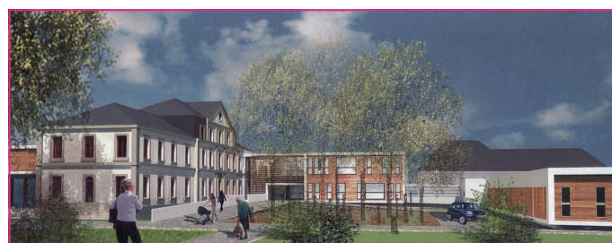
Projet du Centre de Keraudren

" La maison de retraite des prêtres à Keraudren a été rachetée par BMH et sa gestion confiée à l'association Ty Yann. Ty Yann