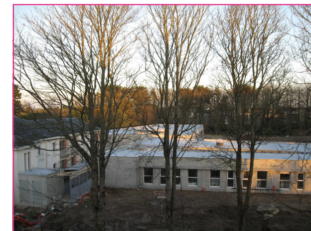
Vue du chantier de Keraudren