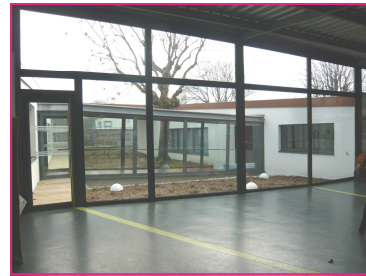
Des espaces et de la lumière