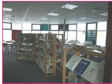
BCD de l'école