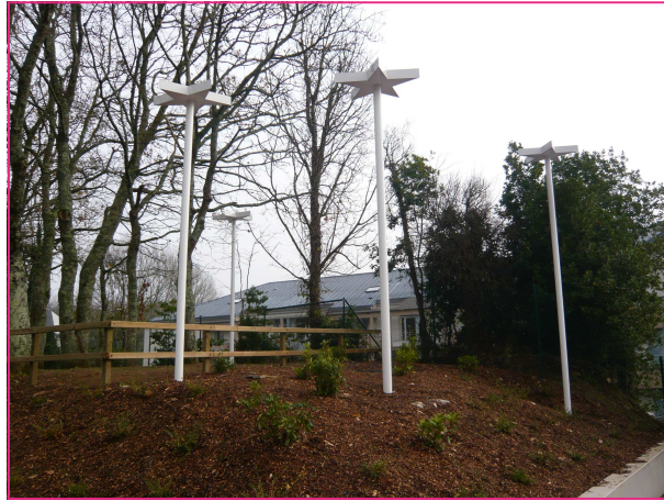
Les étoiles d'Alix Delmas-ADAGP