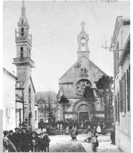
A droite, une photo de 1920, avec l'ancien clocher qui a été détruit en 1944, et la chapelle ND de Lourdes. On voit encore son clocheton.