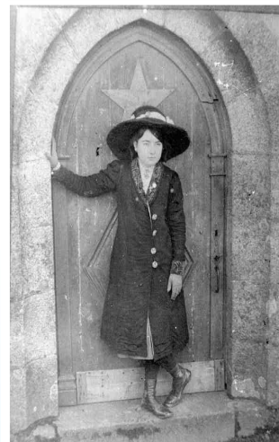
1912 : une jeune fille à l'entrée de la chapelle Sainte-Brigitte