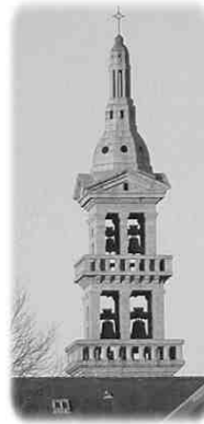
Ci-dessus : le clocher actuel, qui date de 1953.

Mais quelles sont donc ces deux statues de chaque côté du porche qui vous regardent ?