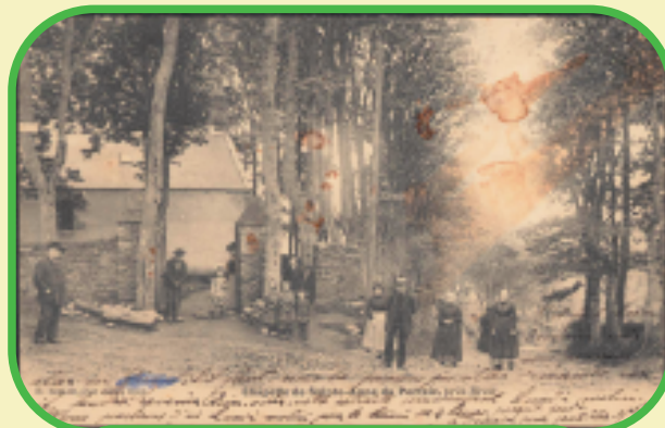
La chapelle, il y a un siècle.