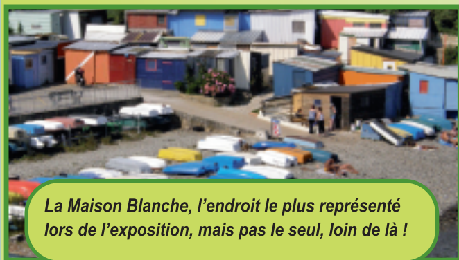
La Maison Blanche, l'endroit le plus représenté lors de l'exposition, mais pas le seul, loin de là !