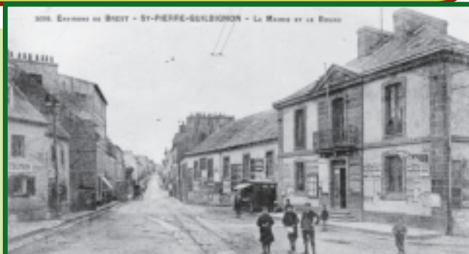
Le bourg de Saint-Pierre-Quilbignon : à droite, la mairie et l'école publique.

On parle parfois du bombardement qui s'est passé pendant la dernière nuit. Il nous arrive aussi de commenter les informations captées clandestinement et sous fond de brouillage, en famille ou entre voisins, oreille collée au poste de la TSF. Elles sont émises par la BBC de Londres, au cours d'un programme en français. Entre élèves on parodie les mystérieux messages adressés aux différents groupes de résistants. Mais pour ces derniers on craint le pire pour leur mode de vie, traqués par la Gestapo et ses infâmes bourreaux. Cependant, le temps passant, des bulletins de la radio de la France libre (BBC) ne manquent pas d'informer ses auditeurs des déboires de l'armée du Grand Reich. Il n'en faut pas plus pour que les géopoliticiens en herbe s'en réjouissent ouvertement en les célébrant avec complicité, par toutes formes d'expressions qui évoquent la lettre "V" de victoire. Cela devient un jeu patriotique, pratiqué bien sûr, en cachette du "Fridolin".