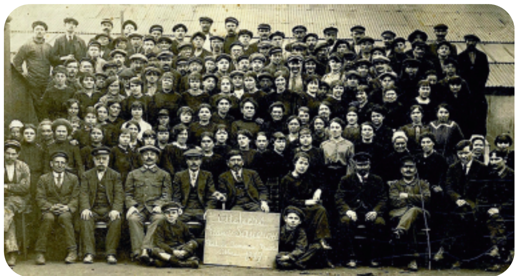
Ateliers Sauviou au Port de Commerce. Fabrication de matériaux pour les armes. Photographie de 1917 : près de la moitié du personnel est composée de femmes.