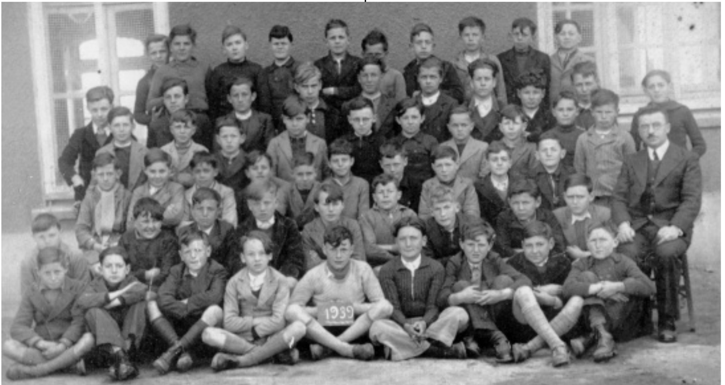
Sur la photo de cette classe de 1939, vous reconnaîtrez peut-être un piqueur de pommes