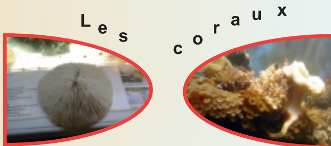
Un corail mort

Le poisson ne nage pas bien, reste au fond, les ouïes ont changé de couleur, etc. Il est alors isolé car on suspecte une maladie bactérienne d'origine inconnue qui peut contaminer les autres. Celui-ci restera 40 jours à l'hôpital et sera soigné avec les mêmes médicaments que pour les humains (bleu de méthylène, chlorure de sodium, mercurochrome). Une fois "guéri" il peut retourner dans son aquarium !