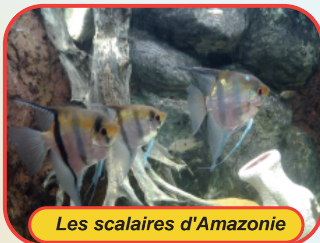
Les scalaires d'Amazonie

La reproduction se fait sur place. Mâle ou femelle ? La taille, la couleur, les espèces et les comportements permettent de le savoir, mais cela est bien compliqué, et seul un spécialiste peut y répondre !