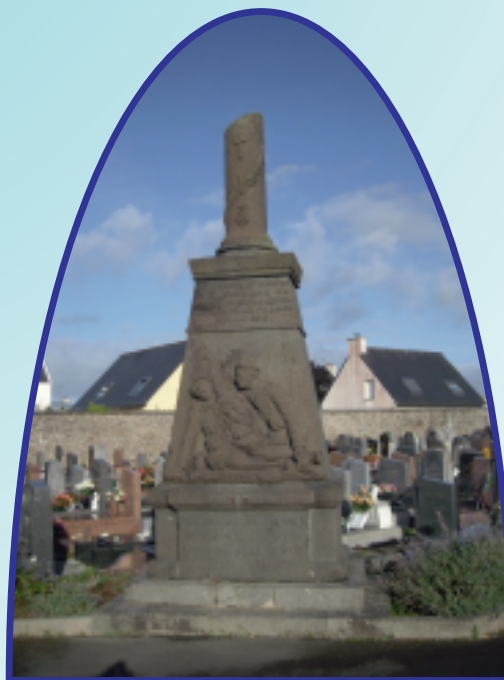
Le monument aux morts. La colonne brisée, tronquée par le haut, évoque la mort prématurée de jeunes hommes en pleine force de l'âge, pendant la guerre 14-18

Vers 1970, le cimetière est agrandi par l'acquisition de parcelles de terre, situées au nord des précédentes.