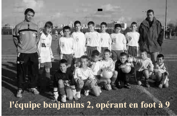
l'équipe benjamins 2, opérant en foot à 9