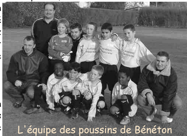
L'équipe des poussins de Bénéton

Brest Bénéton Club s'est associé avec le Stade Quilbignonnais pour permettre à une quarantaine d'enfants de 6 à 12 ans du quartier de Kerourien d'être