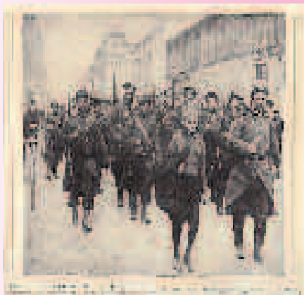
Bataille de Dixmude

Pour beaucoup, le nom de cette rue évoque peu de souvenirs. Et pourtant, cette ville néerlandophone de Belgique de 15 000 habitants à notre époque, fut le théâtre de combats sanglants et glorieux du 18 octobre 1914 au 10 novembre 1914. Elle a été détruite et dut être reconstruite entièrement. Après la bataille de la Marne, les Allemands cherchent à contourner les forces alliées en passant le long de la mer, ce fut la course à la mer. 100.000 allemands cherchent à gagner Dunkerque, Calais et se heurtent aux troupes