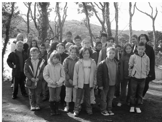
Les enfants du séjour

Des activités non sportives ont aussi été proposées le matin : théâtre et multimédia. Le multimédia encadré par « 2 spécialistes de l'informatique » a permis aux enfants de réaliser eux mêmes une page web, sur le site du Foyer, qui informait sur le déroulement du séjour quasi en temps réel, avec photos et vidéos.