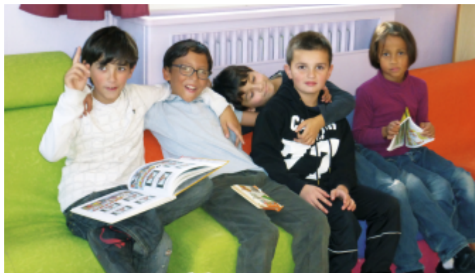
Entre récréation et TAP (école Freinet)

Au bénéfice de l'enfant, le temps d'enseignement de 24h hebdomadaires réparti sur 9 demi-journées est complété par les temps d'activités périscolaires (TAP). Chaque journée est ainsi diminuée de 45 minutes en moyenne. A Brest, pour en faciliter l'organisation, les TAP ont lieu deux fois par semaine sur une heure vingt de façon à mettre en place des animations de qualité.