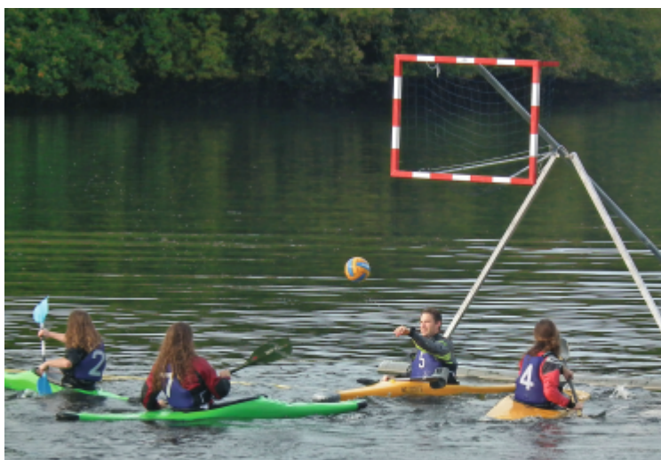
Entraînement de kayak polo

Entraînement les samedis matins (CKB : tél. 02 98 41 69 40)