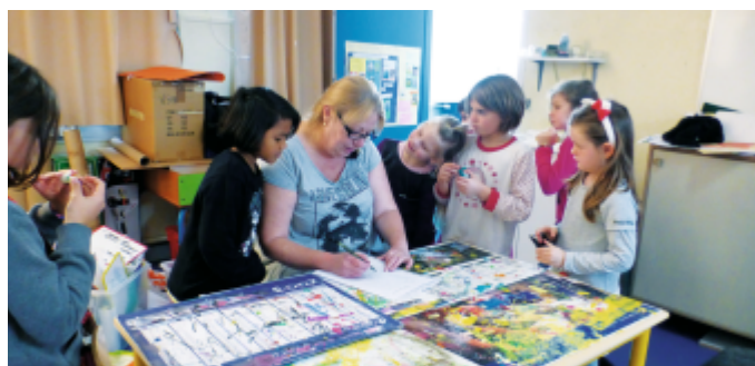
Préparatifs des activités manuelles (école Freinet)