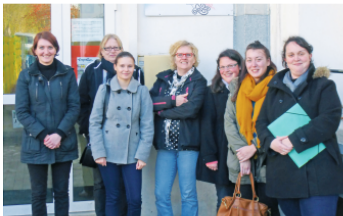
Des animateurs TAP devant l'école Freinet

89% des enfants des écoles élémentaires et 79% des enfants des écoles maternelles participent aux TAP à Bellevue.