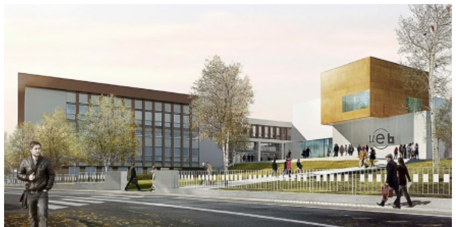
Vue de synthèse des futurs bâtiments

Le pôle numérique Brest Bouguen accueillera quatre salles. Il hébergera le service ingénierie d'appui et de médiatisation pour l'enseignement ainsi qu'un plateau de tournage multimédia. Sa livraison complète est prévue pour le printemps 2016 mais une grande partie des services sera exploitable dès mi-2015. Ce bâtiment, construit juste à côté de la bibliothèque universitaire du Bouguen, sera en connexion avec l'UBO. Il sera au cœur du campus.