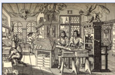
Imprimerie au XVIII e siècle

Romain-Nicolas Malassis , issu d'une famille d'imprimeurs, est né le 14 avril 1737 et décédé à Brest le 13 avril 1813. Imprimeur du Roi et de la Marine à Brest, son imprimerie est située dans la Grande-Rue (ou rue Impériale) aujourd'hui rue de la République. Conseiller de la ville de Brest et capitaine de la milice bourgeoise, il renonce à cette charge et devient membre de l'administration municipale. Élu député du Finistère en 1791 à l'Assemblée législative, membre du comité de la Marine au sein de cette assemblée, il publie à ce titre de nombreux rapports. En 1792, il est élu maire de Brest. Il accepte les fonctions d'assesseur du juge de paix en 1797. Romain Malassis est l'auteur du Journal de Marine , des Mémoires de l'Académie de Marine et du bulletin Etats Généraux . Vers 1800 il se retire à Guipavas.