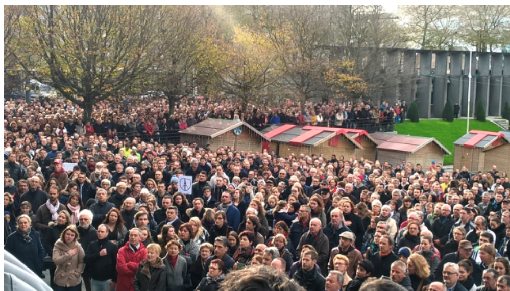
Les Brestoïsolidaires le 15 novembre place de la Liberté

Une église, une mosquée Un temple Une synagogue Et le peuple de France Dieu, Abraham, Moïse Mahomet, Allah, Ezéchiel Et le peuple de France Un stade, des cafés Une salle de concert Des tirs de kalachnikov Des kamikazes Et le peuple de France Des morts, des blessés Des rescapés, des traumatisés Une minute de silence Et le peuple de France Révolte, indignation, émoi Peur, dignité Compassion Et le peuple de France Liberté, fraternité, égalité Une culture partagée Des valeurs communes Une république Et toujours, le peuple de France.