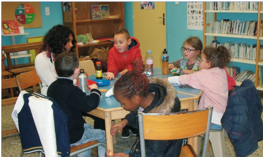
Le club Kilitou de l'école Langevin au goûter