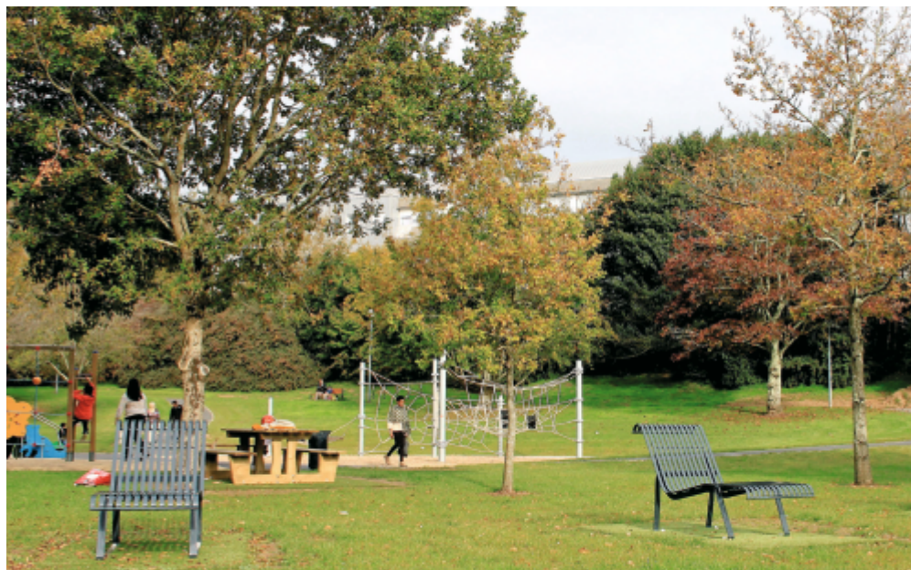
Le jardin Youri Gagarine réaménagé

Les Espaces verts de la ville ont réalisé ces trois demandes tout en tenant compte des contraintes budgétaires. D'autres demandes issues de la consultation devraient être satisfaites ultérieurement, mais un grand pas a déjà été franchi. N'hésitez pas à venir découvrir cet agréable espace de détente.