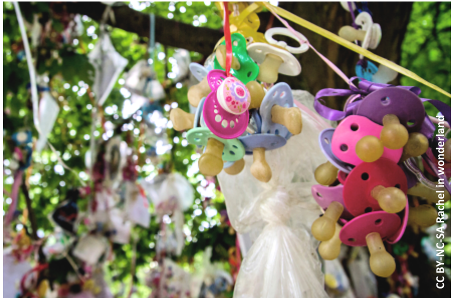
Des enfants confient leur tétines aux branches d'un arbre