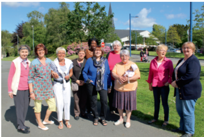
Des bénévoles motivés et actifs

Créée en 2009 par un groupe de bénévoles du centre social Kaneveden, Solidarité Sabou apporte une aide à des enfants orphelins et démunis de Sabou au Burkina Faso. L'association agit en partenariat avec une association locale Faag Taaba , créée par des jeunes étudiants et artisans, dont le nom signifie s'entraider en langue locale. L'objectif est d'assurer un avenir à des enfants burkinabés.