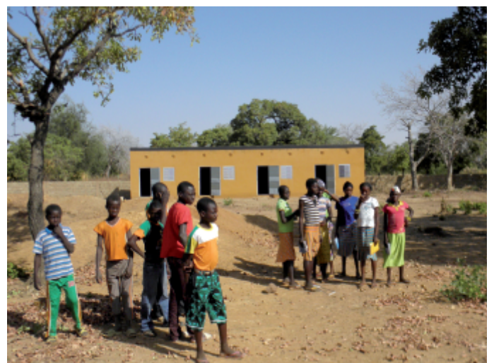
Le centre d'accueil réalisé à Sabou par Faag Taaba

Contacts : solidaritesabou@gmail.com ; tél. : 02 98 03 55 66