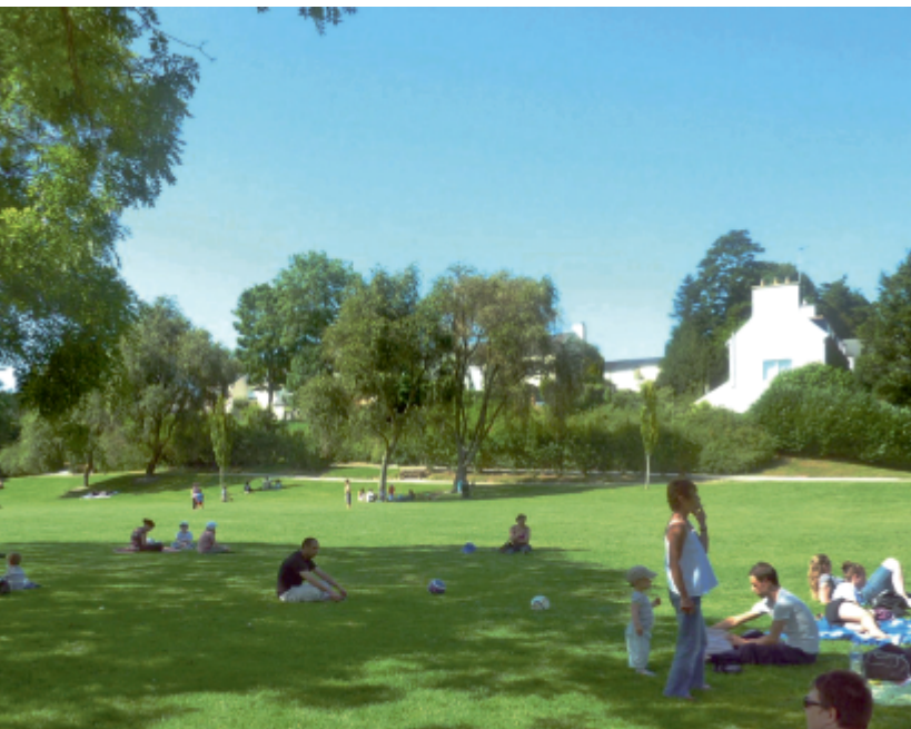
La grande pelouse des Rives de Penfeld

Brest métropole océane offre 39 m 2 de surface d'espaces verts par habitant, pour une moyenne nationale de 25 m 2 . A Bellevue, les Rives de Penfeld représentent 56 hectares qui sont entretenus tous les jours par la même équipe de 5 jardiniers encadrés par un agent de maîtrise.