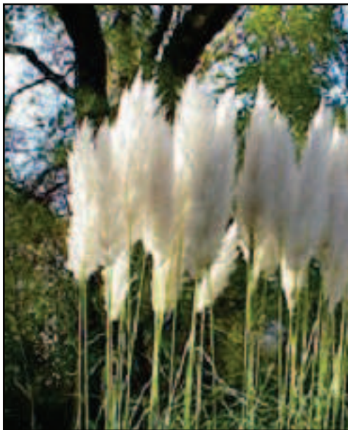
Herbe de la pampa

On nomme ainsi toute plante importée (exotique) qui, se multipliant en abondance une fois accoutumée à son nouvel environnement, concurrence et menace la biodiversité locale.