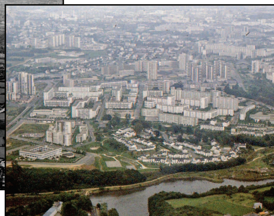
1979 - Photo A.Bouchard

L'année 2013 approche et avec elle l'occasion de fêter les 50 ans de Bellevue. En effet c'est le 27 juin 1963 que ce quartier a été officiellement inauguré (pose de la première pierre de la Zup et inauguration du pont Robert-Schuman).