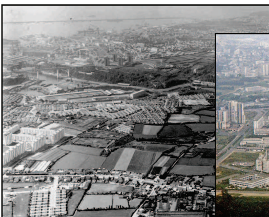
1960 - Photo Heurtier - Rennes