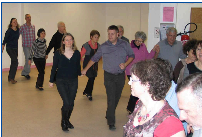
Korollerien lenn-vor : cours de danse