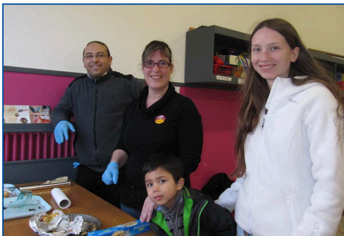
Vente de gâteaux lors du Téléthon 2012

Sous l'impulsion de quelques enseignants et de parents motivés, l'école Dupouy a vu, depuis la rentrée scolaire, l'association des parents d'élèves reprendre vie. L'objectif principal est d'assurer la kermesse de fin d'année mais également d'organiser des actions en cours d'année afin de participer à la vie du quartier et à celle de l'école en proposant des sorties au profit des élèves. L'APE Dupouy s'est investie dans le Téléthon de Bellevue par la vente de gâteaux, a organisé un marché de Noël et un vide-grenier.