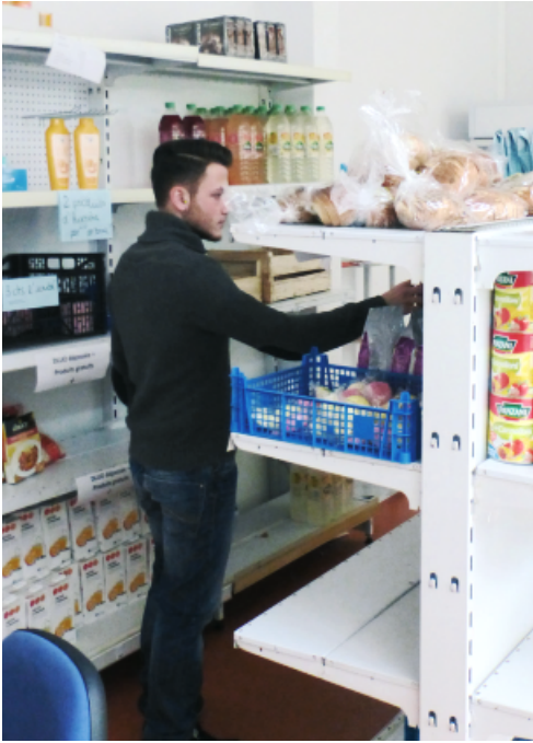
Le local de l'AGORAé