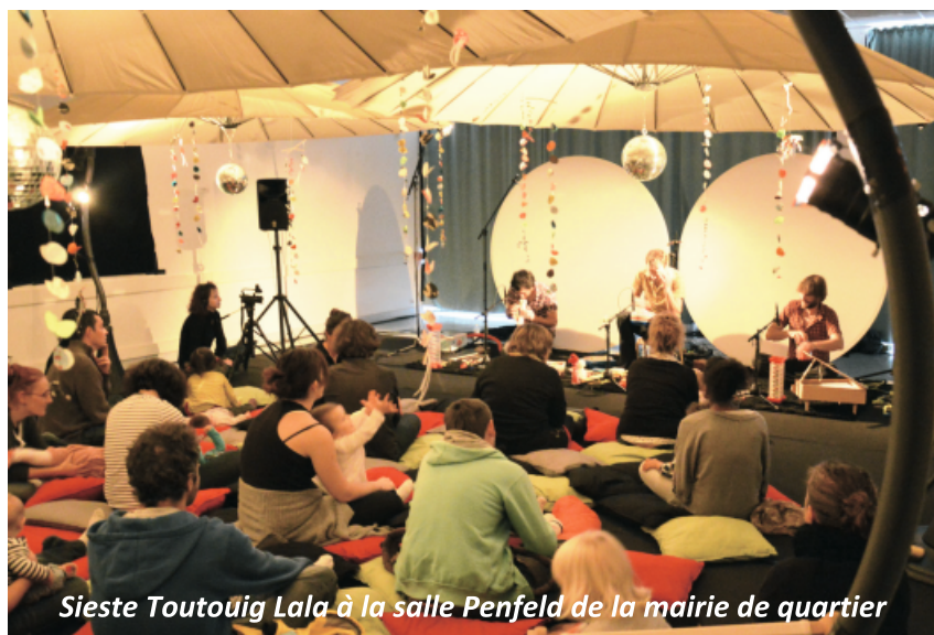
Sieste Toutouïg Lala à la salle Penfeld de la mairie de quartier

Ces projets peuvent voir le jour grâce à la participation financière du PEL, de la CAF et de La Carène.