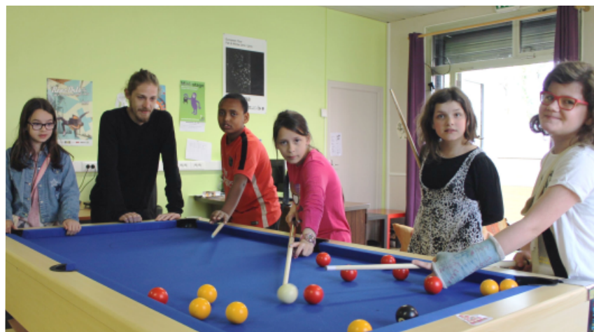
Le billard est apprécié par les préados !

Il s'agit d'accueillir des enfants qui possèdent une certaine autonomie. Nous ciblons particulièrement les premières années du collège et certains CM2 qui sont assez mûrs pour intégrer le secteur. La Maison de quartier de Bellevue accueille les jeunes au-delà de 14 ans. Nous allons mettre en place des actions en partenariat pour favoriser cette passerelle vers 13-14 ans.