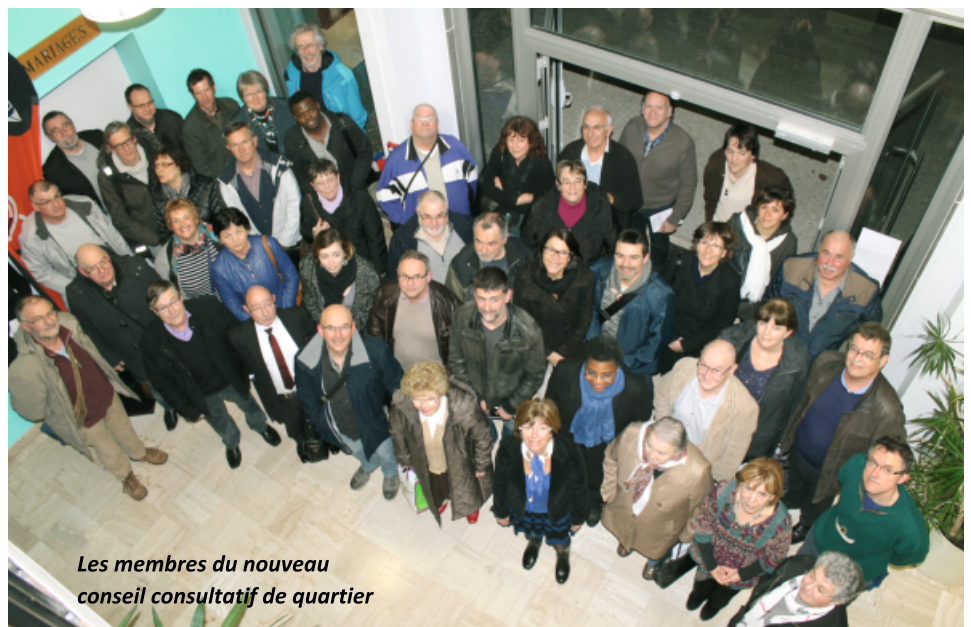
Les membres du nouveau conseil consultatif de quartier

* Constituée des élus et des services administratifs et techniques