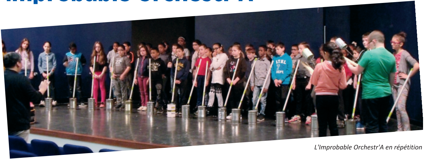
L'Improbable Orchestr'A en répétition

Bellevue fête le printemps a débuté par l'Improbable Orchestr'A sur la scène de la salle Outremer du centre social Kaneveden de Bellevue.