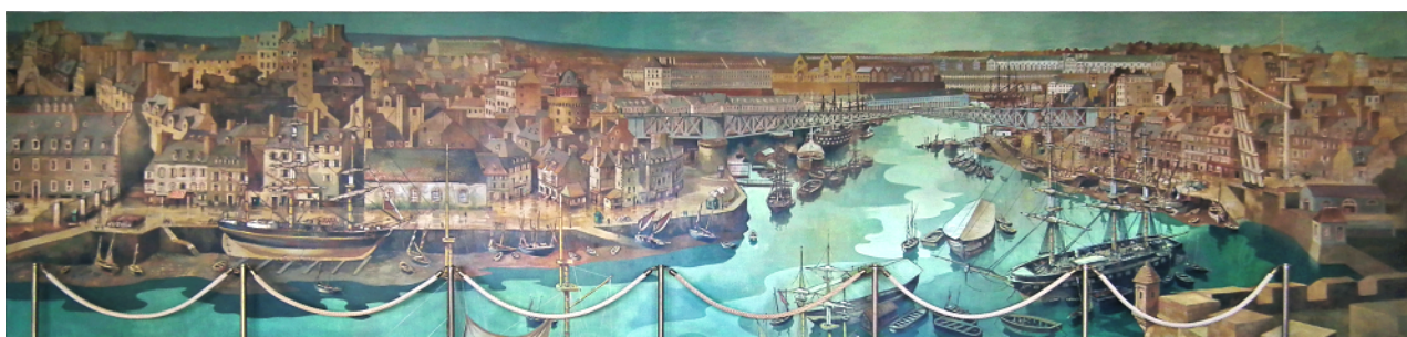
Fresque de la salle des mariages de la mairie de Bellevue (Pierre Péron)

Qui prend le temps de laisser son regard flâner dans le quartier trouvera une bonne vingtaine d'œuvres discrètes mais toutefois dignes d'intérêt