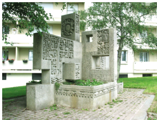
Fontaine rue duc d'Aumale (Bruno Lebel)