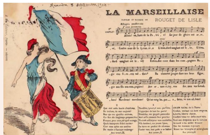
Partition illustrée de La Marseillaise (JH Editeur)

Aux six couplets de Rouget de Lisle on ajouta un 7 e , le couplet des enfants (14 novembre 1792). La version officielle et le rythme ont été fixés en 1887.