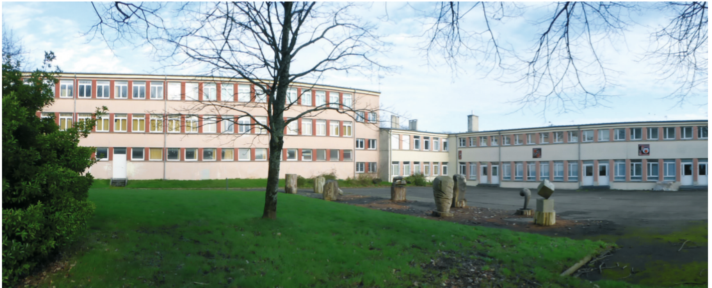
Les bâtiments de la rue du Chatellier hébergent l'annexe du conservatoire de musique et l'Eesab

L'ancienne école publique du Bergot, entre l'avenue Le Gorgeu et la rue du Chatellier, abrite depuis 10 ans l'annexe du conservatoire régional de musique, de danse et d'art dramatique dans son aile Nord et celle de l'Eesab (école européenne supérieure d'art de Bretagne) dans son aile Est.