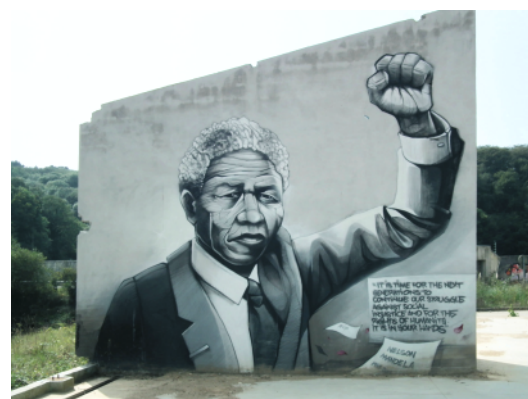
Hommage à Mandela (PakOne), 2013 porte de l'Arrière-garde

Pour en savoir plus sur ces œuvres, visiter la rubrique histoire et patrimoine du site www.brest-bellevue.net