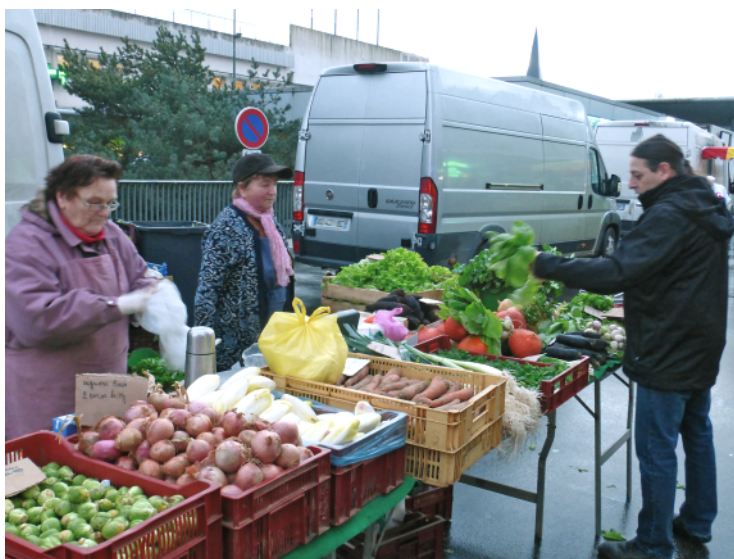
Dès l'ouverture du marché, les légumes frais sont dans le cabas

*La Pause, 36 rue du professeur Langevin, Brest