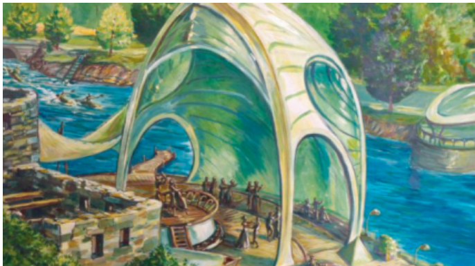
Penfeld 2050 - vue par le dessinateur brestois Gwendal Lemercier

La Penfeld méritait donc une réflexion prospective afin d'imaginer son évolution pour les 10, 20, 30 ans à venir.