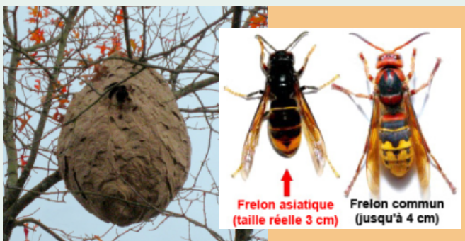
Frelon asiatique (taille réelle 3 cm) Frelon commun (jusqu'à 4 cm)

Pour vous informer sur les frelons asiatiques et la destruction des nids, rendez vous dans votre mairie de quartier et consultez le site www.brest.fr (mot-clé : frelon asiatique)