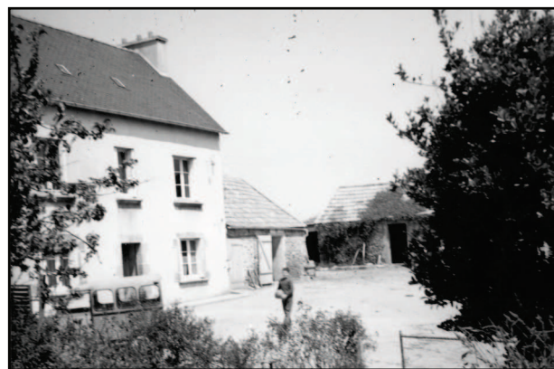
La ferme de Kerguerec