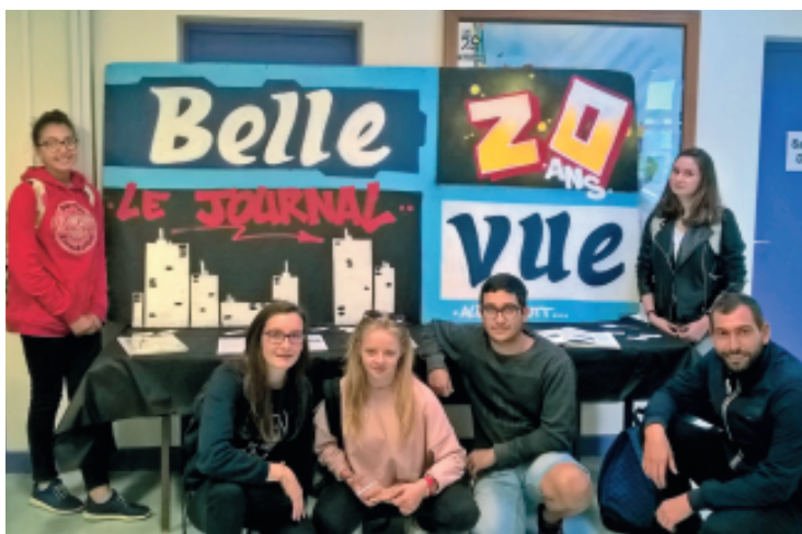
Sur les conseils de Shire, des jeunes de la maison de quartier ont réalisé ce graff à l'occasion des 20 ans du journal Bellevue