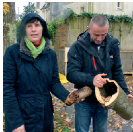
Les spécialistes des espaces verts de Brest métropole montrent que les branches des érables sont creuses

* plus d'infos sur : www.brest-bellevue.net