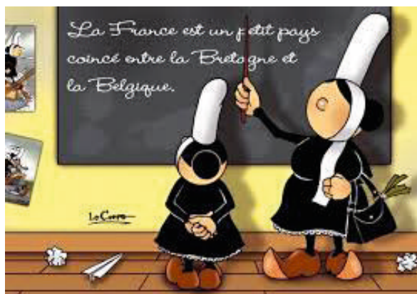
Illustration de Nikolaz Le Corre

L'Université du temps libre (UTL) est une association créée en 1976 par le service de formation continue de l'UBO (Université de Bretagne occidentale).