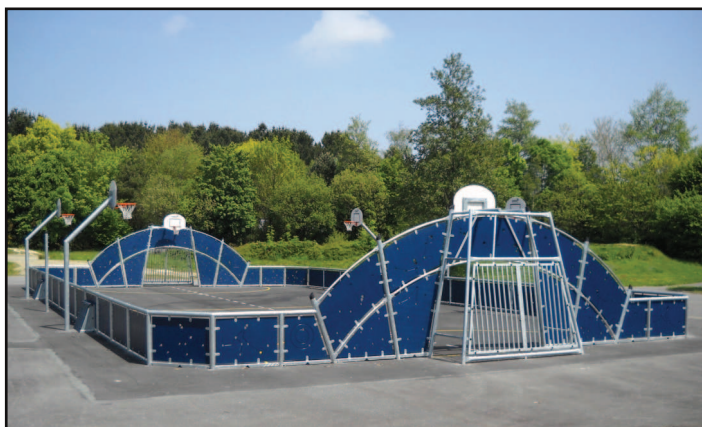
L'aire multisport à Kerbernier

- Rue du Béarn : un projet de réaménagement est en cours d'étude. Il a été présenté aux habitants du square du Béarn et sera par la suite présenté également aux membres du CCQ.