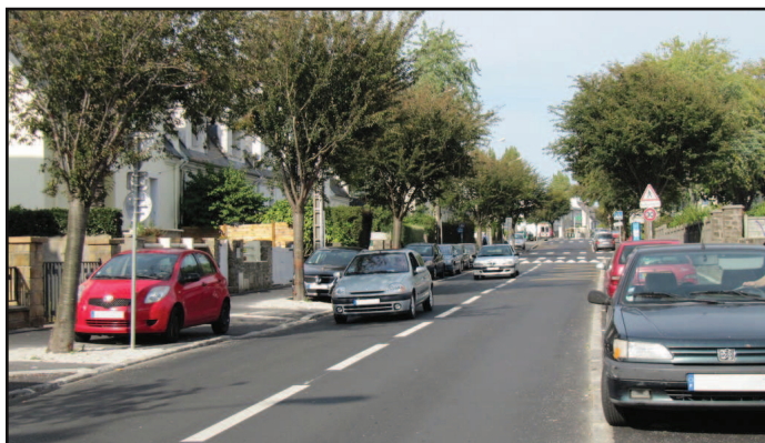
Le stationnement a été nettement amélioré rue Professeur Langevin