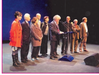
Discours de Mr le maire