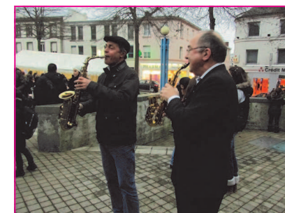
Ambiance saxo pour cette édition