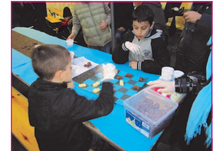
Jouer aux dames avec des chocolats!!