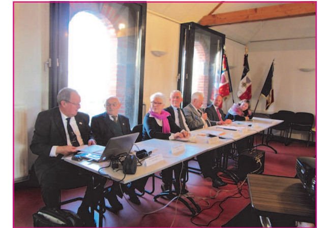
Le bureau de l'U.N.C. pendant l'assemblée générale