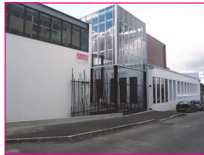
Vue de la rue Goasdoué