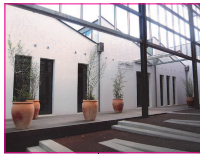
Salles de travail