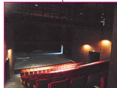
Salle de spectacle de 300 places