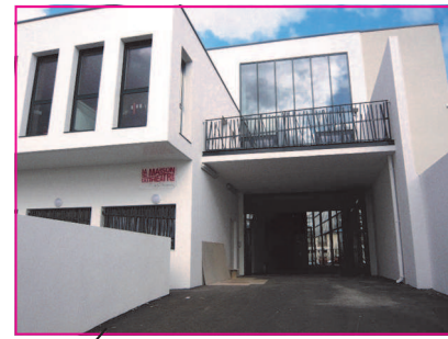
Vue de l'arrière