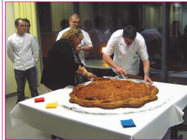
Découpe de la galette façonnée par l'IFAC

Mais soyons fous et faisons comme disent encore les personnes âgées « allons sur Brest » car nous ne pouvons vivre ici sans tenir compte de notre identité brestoise. L'évolution du plateau des capucins intéresse les habitants de Lambé, les membres du Conseil consultatif de quartier ont d'ailleurs participé avec beaucoup de plaisir à certains travaux. C'est notre passé commun, notre histoire qui refait surface pour notre plus grande joie.