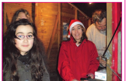
Ce sont eux, les bénévoles à qui l'on doit la réussite de cette 3ème fête du chocolat