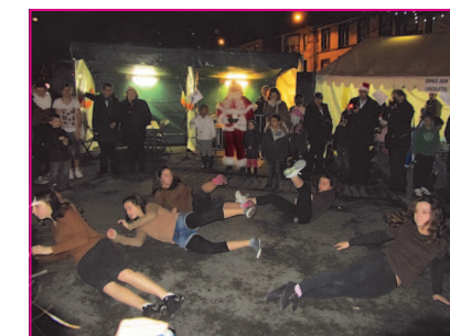
Pen-ar-C'hleuz en démonstration