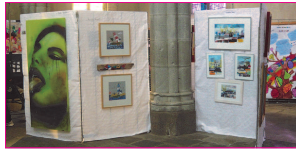
Panneaux d'exposition de peintures