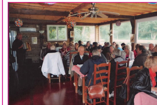
Au déjeuner ambiance « guinguette »

Sortie de l'U.N.C. de Lambézellec (Union Nationale des Combattants) du jeudi 30 septembre 2010 à Châteauneuf du Faou- une première pour une association presque centenaire. Entre Monts d'Arrée et Montagne Noire, premier arrêt symbolique devant le Mémorial de Pleyben érigé en mémoire des finistériens morts en Afrique du Nord: 5 stèles en granit et combien de noms gravés dans la pierre? 10 sont de Lambézellec. Un moment de mémoire...comme un devoir! Mémoire et puis plaisir...Celui du déjeuner à Châteauneuf du Faou fut celui qu'il promettait d'être ... La suite P7