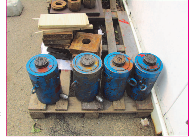
Les vérins qui ont servi à soulever le tablier