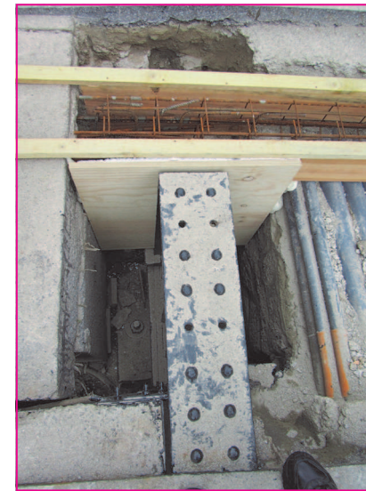
La culée avec espace de dilatation

Les travaux réalisés au cours de l'été ont été les joints de dilatation de l'ouvrage par la création d'une grille en surface et de béton en dessous, en laissant une ventilation circuler autour des tracés pour empêcher les agrégats de partir sous le pont, ceci pour éviter toute dégradation prématurée dans le temps. Côté Brasserie, le pont est en point fixe, et côté Lambé le pont, après travaux, a été remis sur