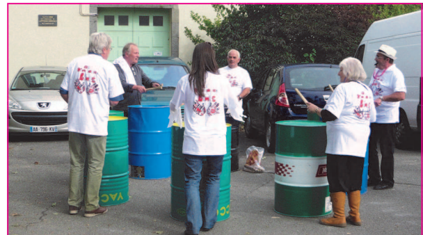
Les tambours de Kérinou en action