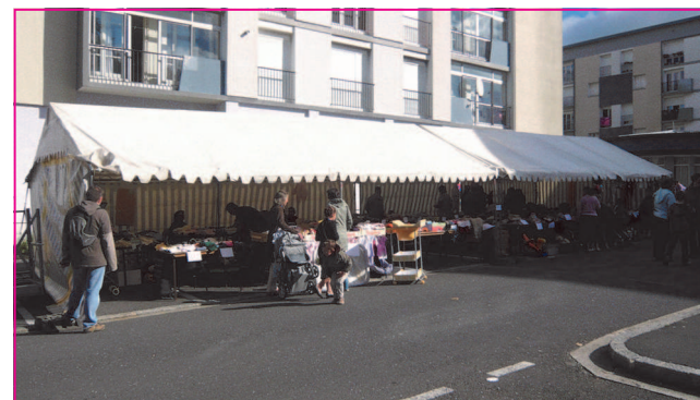
La bourse à la puériculture

Parallèlement, parents, enfants, assistantes maternelles présents ont pu assister aux spectacles « les 3 poulettes » de la conteuse Sylvie Gougay, suivi de « la Forêt qui chante » par l'association d'assistantes maternelles de Locmaria Plouzané. La Médiathèque a également mis en place des animations autour du livre, et les petits lecteurs ont été comblés.