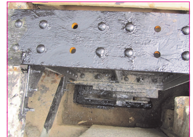
Une culée sur son rouleau