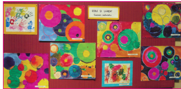
Panneau réalisé par l'école maternelle de St Laurent

Exposition de peinture, dans l'église, des différentes écoles de peinture du quartier et aussi de panneaux effectués par les écoles.