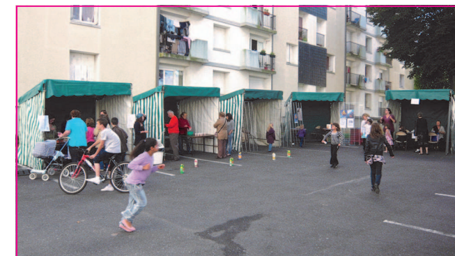
Les stands des associations du quartier