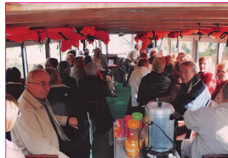
Au fil de l'Aulne sur la vedette de Pen ar Pont