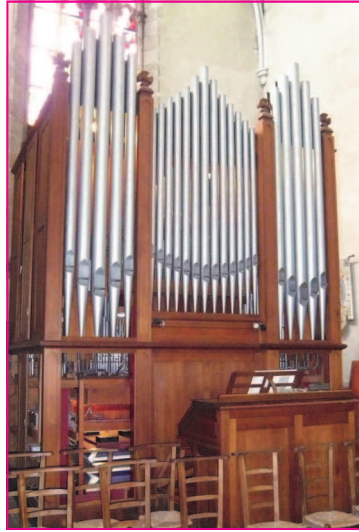
L'orgue de l'église de Lambé

Les festivités de "Un dimanche à Lambé" en date du 3 octobre ont débuté la veille par un concert, à l'église, offert par "Les amis de l'orgue". Malgré le temps maussade, le public a pu autour des organistes de l'église, écouter un programme très divers, de pièces de musique, de chants accompagnés de l'orgue de l'église et de nombreux autres instruments.