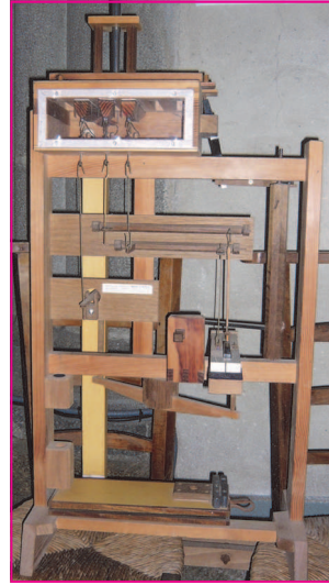
Maquette d'un registre