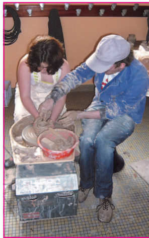
Apprentissage au tour de potier

Le dimanche après-midi, la météo ayant prévu un temps pluvieux, la décision de mettre les activités ludiques dans l'école Buisson avait été prise et c'est sous un beau soleil que se sont déroulés les diverses activités: expositions et démonstrations artistiques (peintres, sculpteurs, potiers, mosaïstes, etc.). Animations et activités pour enfants. Concerts musicaux. Dégustation de crêpes et thé à la menthe.