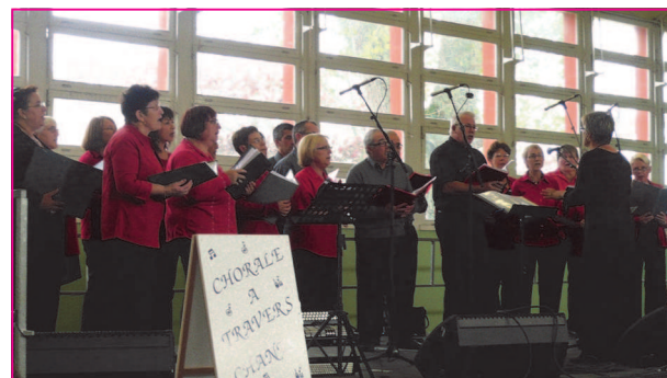
La chorale « A travers chants » de la MPT