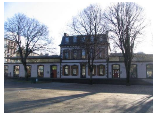
Ecole des garçons, Place Guérin