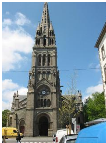
Eglise Saint Martin