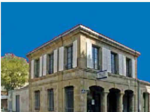
Poste de police

Cet endroit est aussi très apprécié des étudiants et beaucoup y résident. Ce n'est sans doute pas un hasard.