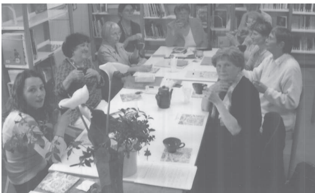
Cérémonie du thé au club de haïku