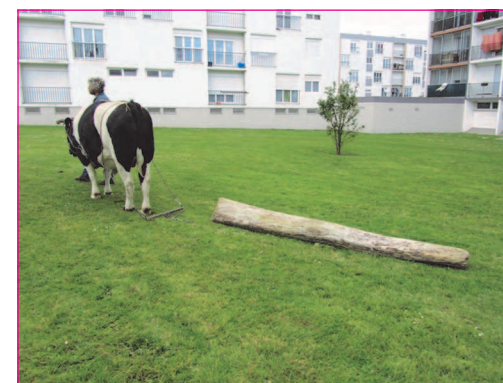
Démonstration de débardage avec un bœuf.