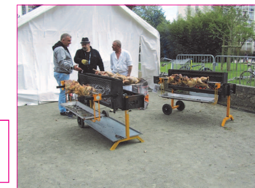
Pendant ce temps les poulets fermiers cuisent sous surveil-