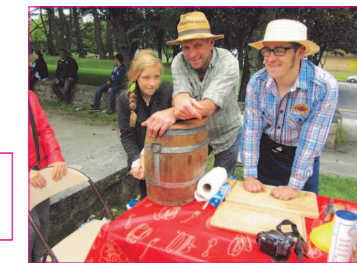
Pour les laitiers, ce fut un succès plus de beurre à donner.