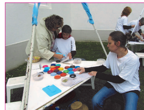
Atelier maquillage pour les petits

Et puis pour les bricoleurs : la réparation des vélos, eh oui il faut parfois mettre les mains dans le cambouis. Une belle fête, pour tout le monde animée par les chants des enfants, de biniou et bombarde et autres chanteurs connus comme Jean-Luc Roudaut entonné par les enfants tout droits sortis de l'atelier de maquillage. J.F.R.