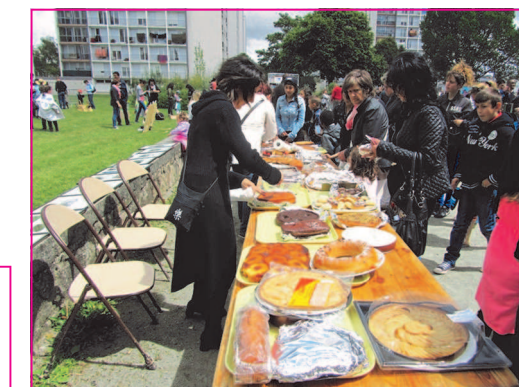
Les gourmands n'avaient que l'embaras du choix