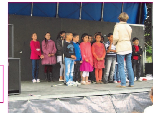
Chant chorale pour les écoliers de Paul Dukas