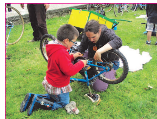
Atelier réparation pour les vélos