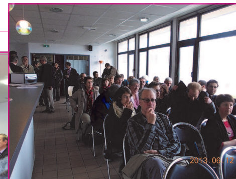
Un public nombreux