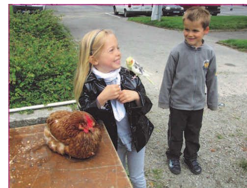
Les oiseaux font toujours recette auprès des enfants