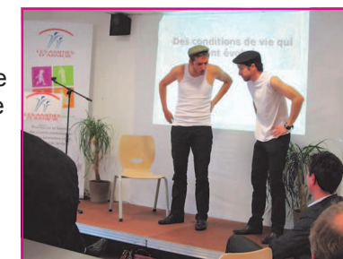
Impro-infini en action