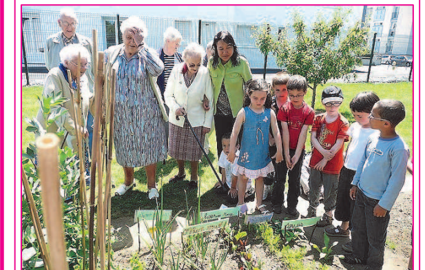
Les personnes de la maison de retraite de KERMARIA visitent le jardin de la classe de grande section.