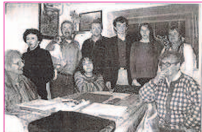
Le premier bureau d'un « Dimanche à Lambé »

Saluons aussi tous leurs fidèles partenaires et les nombreux bénévoles qui, dans l'ombre, s'activent avec efficacité et dévouement pour que la fête soit une réussite . Souhaitons que la fête « Un dimanche à Lambé » soit encore longtemps pour les habitants de Lambé et d'ailleurs, un grand moment convivial de joies, de rencontres et de découvertes . J.C.