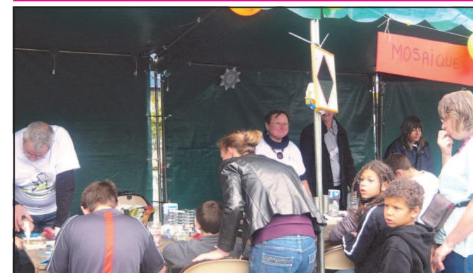
Ici l'atelier de mosaïque avec un groupe d'artistes studieux