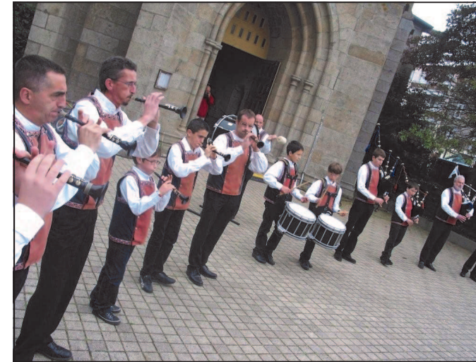
Ouverture des festivités, en fin de matinée avec le bagadig de Plabennec, avant le pot d'accueil.