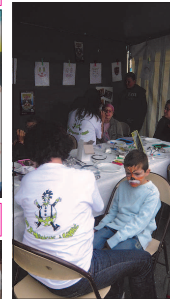
Le maquillage des visages d'enfants a toujours du succès et le stand était pris d'assaut dès 14h.