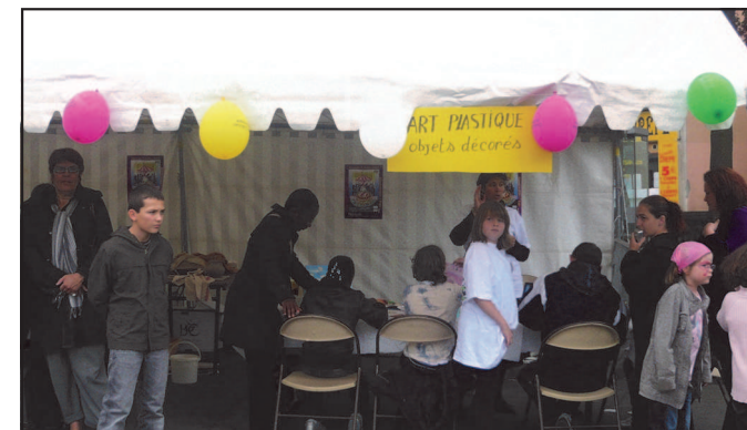
On se bouscule au stand des arts plastiques.