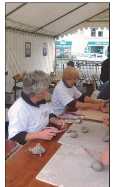
L'initiation à la poterie a connu une belle activité durant tout l'après midi. Les bénévoles très concentrées sur l'ouvrage.