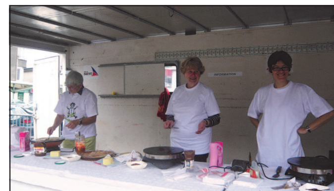
Les amateurs de crêpes, de petit café et autres dégustations, étaient attendu, de pied ferme, par une équipe de bénévoles souriantes.