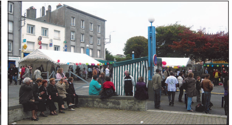
Le temps ayant été clément, un public nombreux s'est pressé parmi les stands où se déroulaient des activités artistiques, les expositions de peinture, et de souvenirs du vieux Lambé à l'église, tandis que sur la scène le groupe « Passe Partout » animait la place.