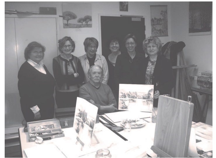
Au PLL: Ces dames devant leur travaux

Crayon, acrylique et aquarelle sont les techniques les plus utilisées pour peindre sur papier ou sur toile. Pour des raisons de commodité (odeur et temps de séchage), l'huile n'est pas employée. Chaque peintre se concentre sur son travail et chaque réalisation est différente et atteint en fin d'année un excellent niveau, comme dans l'exemple cité précédemment quand il s'agit de peindre avec de l'acrylique et du sable sur un journal chinois ou d'appliquer la technique du fondu dans une aquarelle