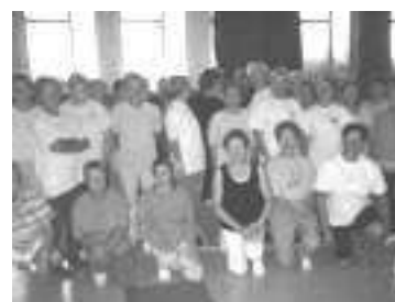
Le succès des séances du jeudi

le mardi de 19h à 20h et le jeudi de 19h à 20h.