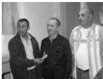
Remise de l'écusson d'arbitre

Cette soirée était aussi l'occasion de la remise des nouveaux maillots en présence des partenaires.