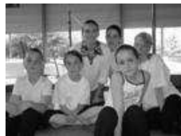
Nos jeunes gymnastes en compétition à Plougastel mai 2005

La saison 2005-2006 vient de redémarrer, 12 enfants de 6 à 8 ans pratiquent cette activité sportive de 14h45 à 16h, et 13 enfants de 9 à 12 ans de 16h30 à 17h45.