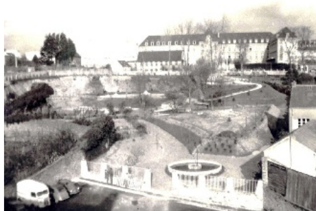
Jardin de Kérinou au début des années 60

Le jardin des années 60 (cf photo) a vieilli. Comment reconnaître, aujourd'hui, cet espace que nous avons fréquenté avec nos enfants dans les années 70 et 80 ? Combien de têtards pêchés dans les bassins et rapportés à la maison dans l'espoir d'une grenouille ? Puis, les enfants ont grandi, tout comme les arbres et les buissons, pour conduire à ce jardin abandonné aujourd'hui : la végétation est trop dense, les accès et circulations en mauvais état, les bassins et autres belvédères sont dégradés.