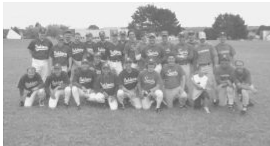
Brest reçoit St Germain-en Laye pour son 1er match de nationale 2 en juillet 2004

Ce titre de champion nous a permis d'accéder à la Nationale 2 . Dans notre poule de 4 équipes, la seule que nous n'avons pas battue était composée pour moitié d'anciens joueurs d'élite.