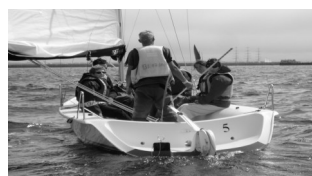
Une partie de l'équipe en sprinto